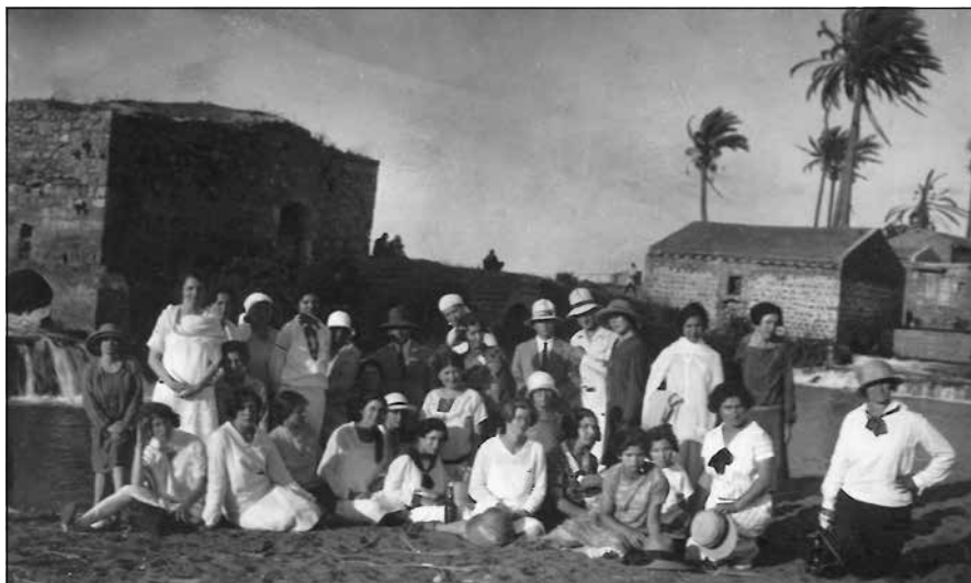
איור 9: טיול לירקון, תרפ"ט (1929)

ד"ר זיידל לא קידם תכניות ייחודיות לנשים, אך בימיו לימדו בבית המדרש מורים ומורות שעיצבו את דמות המוסד והעניקו לו את אופיו הייחודי. דמויות המופת של המורים בסמינר, ובמיוחד של המורות, הקרינו על דרכן של התלמידות לאורך שנים. אף כי סגל ההוראה התנגד לרעיונות פמיניסטיים, החינוך שהעניקו במוסד הביא להעצמה אישית של הבוגרות כנשים, להשתתפותן הפעילה בעיצוב החינוך בארץ ולמעורבותן הפעילה במרחב הציבורי.