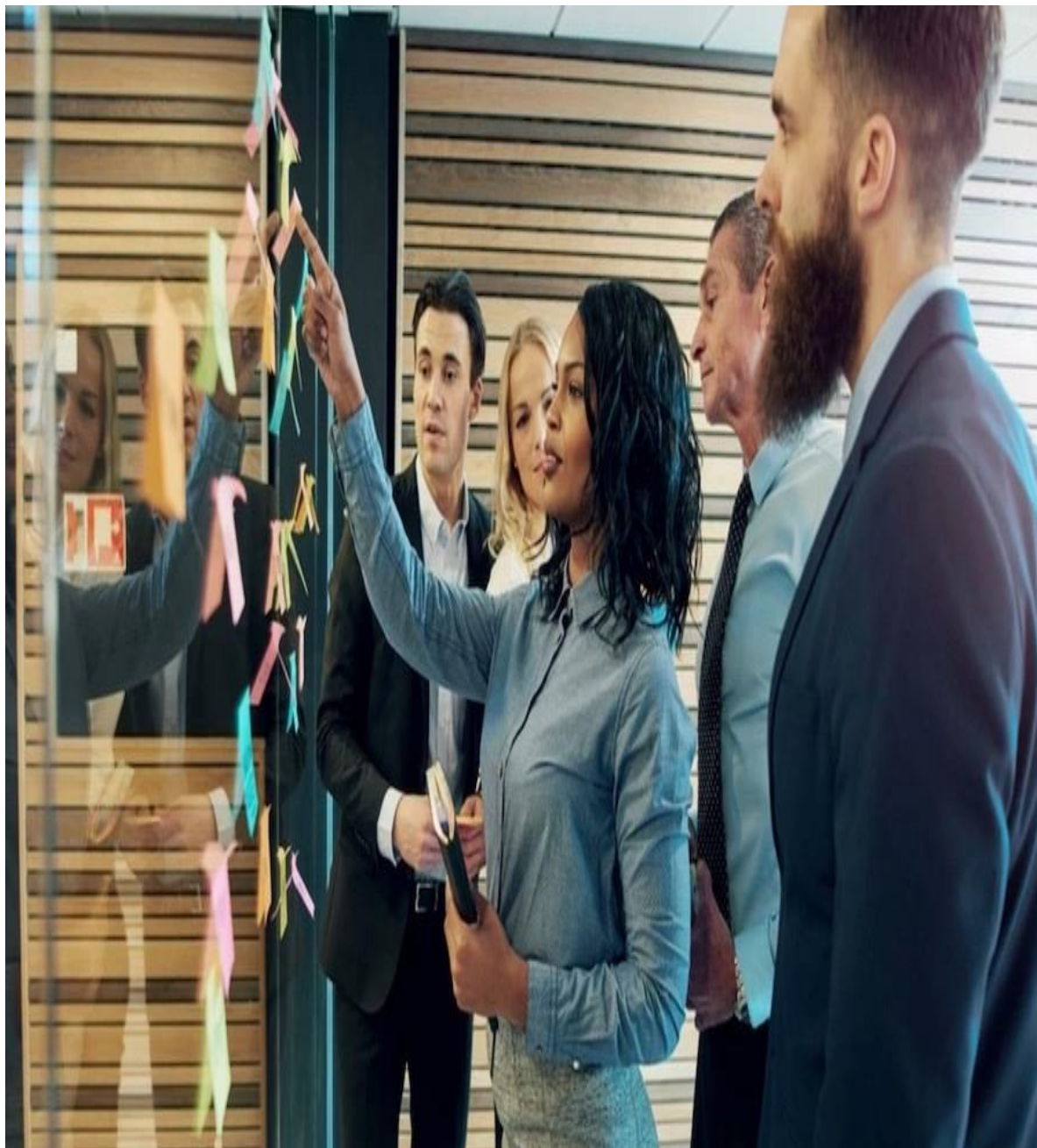
המרכז הישראלי לרכש